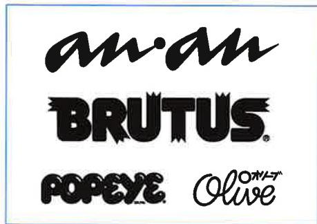
堀内誠一が手がけたロゴデザイン 1970年～

1932年東京に生まれる。デザイナー、アートディレクター、絵本作家。雑誌作りにおけるエディトリアルデザインの先駆者であり、『anan』創刊時には、ロゴ、表紙、ページネーションなどを手がける。海外取材を実施するなど、ビジュアル系雑誌の可能性を大きく広げた。『あかずきん』『雪わたり』『くるみわりんぎょう』など、20代半ばから生涯にわたり60冊をこえる絵本を世に出し、挿絵も数多く描く。1973年から81年にかけてパリに暮らし、世界を巡り、旅先の風景や地図を描き雑誌で発表するなど、多彩な表現に意欲的に取り組む。1987年逝去。享年54。