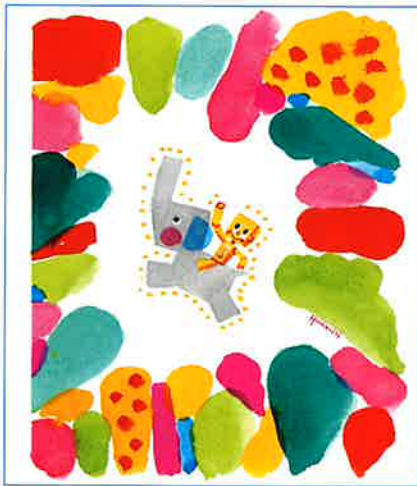
『ロボット・カミイ』1970年 福音館書店